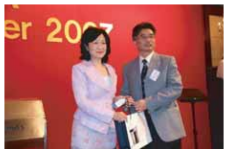
匯賢智庫主席葉劉淑儀頒獎與區志堅先生